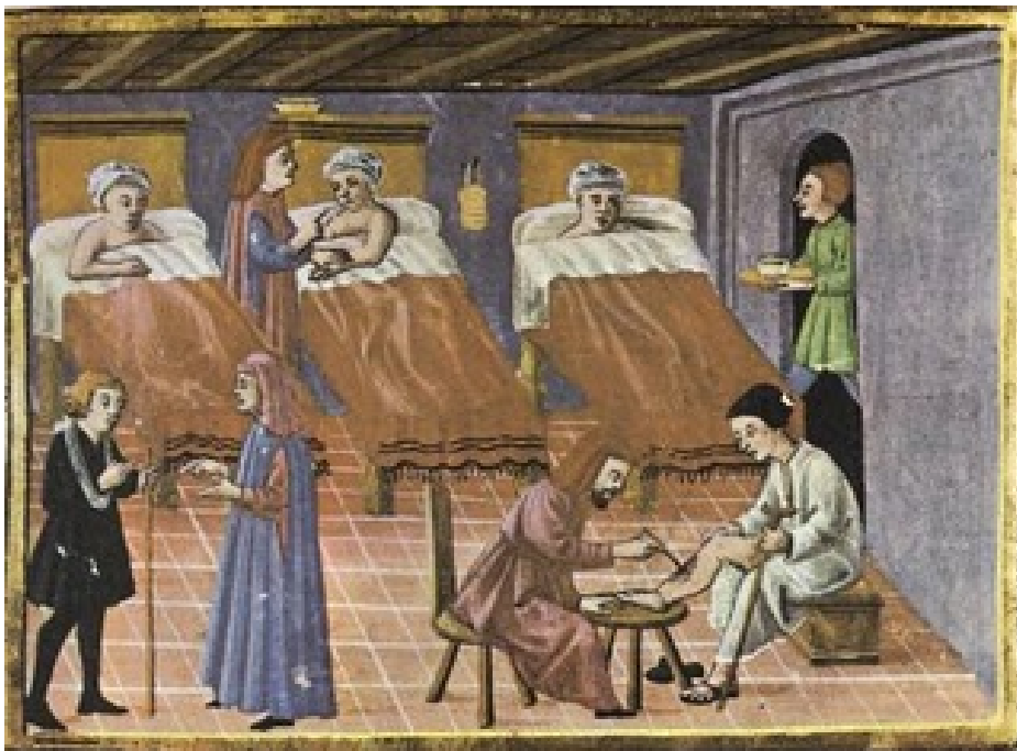
Imatge d'una escena quotidiana en un hospital, representada en un manuscrit italià del segle XV

És certament difícil poder saber, amb seguretat, en quin lloc geogràfic i en quin moment concret van aparèixer els primers establiments assistencials. Se n'han buscat els orígens en l'Antiguitat clàssica perquè se sap que a l'Egipte faraònic existien santuaris amb un cert aire filantròpic on els malalts i els pobres cercaven acolliment. A Grècia, se sap que vers el 500 aC els temples d'Apol·lo, a Delfos i Corint, van ser llocs de pelegrinatge perquè s'hi havien construït santuaris dedicats al déu de la medicina, Asclepi.