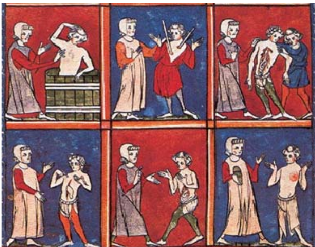
Tractament de diverses ferides a l'Escola de Salern segons un manuscrit del segle XIII ( British Library , Londres).

L'exercici de la medicina practicada pels monjos fora de les infermeries dels monestirs va ser motiu de variades controvèrsies. La visita als malalts fora dels monestirs implicava absències massa perllongades. En les ocasions que s'havia d'atendre a dones, les situacions encara resultaven més complicades. L'Església va prohibir aquestes pràctiques en diversos sínodes, però en especial en els concilis de Reims (1131), Laterà (1139) i en concret en el Cànon 18 del Laterà IV (1215), on específicament es prohibeix als clergues practicar l'art de la cirurgia que comporti vessament de sang.