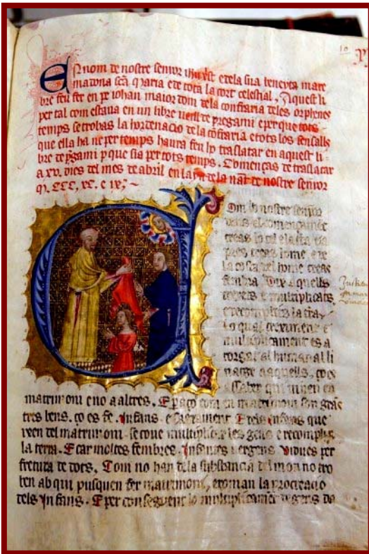
Llibre d'ordinacions d'una confraria medieval.

aplegar formant gremis i confraries. El gremi i la confraria actuaven plegats. El gremi tenia cura de la reglamentació de l'ofici, el control de la qualitat del producte i la lluita contra la competència dels seus membres. La confraria tenia una capella en una parròquia o un monestir de la ciutat on celebrava amb solemnitat les festes patronals i els sufragis pels confreres difunts. Prenien part en les solemnitats públiques de caràcter religiós, especialment en les processons de Corpus i de Setmana Santa,