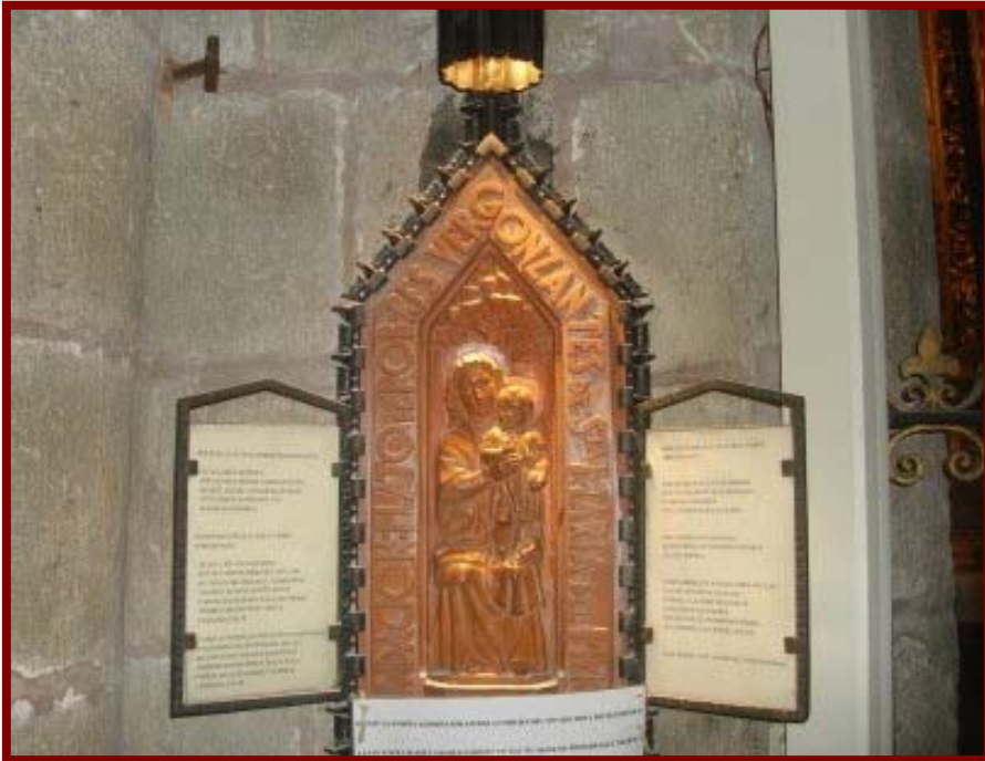
Plat dels pobres de la parròquia de Santa Maria del Pi

pensió o cànon anual a la institució. Aquesta pensió que a l'edat mitjana no podia excedir del 10% del capital entregat i acostumava a ser de l'ordre d'un 6%, segons els llocs, era destinada a complimentar les finalitats específiques que havia indicat el fundador, que acostumaven a ser: rescatar captius, atendre a pobres vergonyants, dotar donzelles a maridar o en religió entrar i estudiants estudiar.