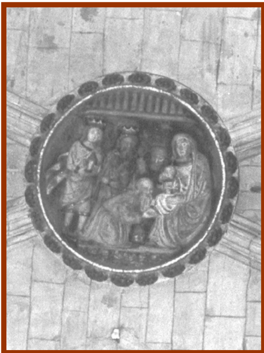
L'Epifania. Clau de volta del segon tram de la nau. S. XIV