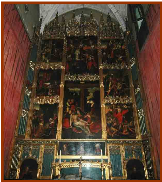
Altar de la Santa Creu de la capella de Sant Feliu, de Pere Nunyes (1530), on s'ha realitzat el testament sacramental des de l'any 1082 fins la seva derogació l'any 1991

També és del segle XVI una important obra d'art: el