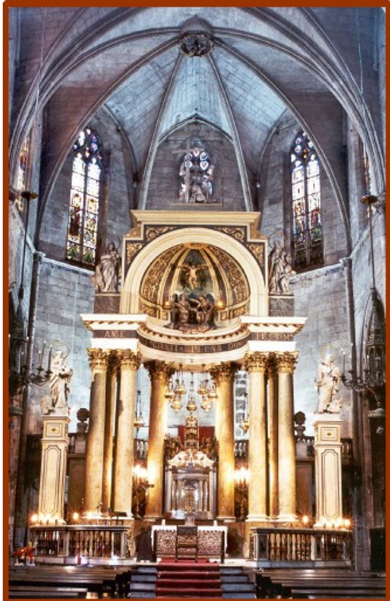
Altar major i presbiteri actual de la Basilica dels Sants Màrtirs Just i Pastor. A la capçalera els vitralls de Jaume Fontanet de 1522.

L'any 1804 es va projectar l'altar major actual, en estil neoclàssic, que es va construir entre 1816 i 1832. Està format per sis parells de columnes de marbre de Tarragona, d'una sola peça, amb capitells d'ordre corinti, de fusta daurada, que subjecten una cúpula absidial, també de fusta, que acull les