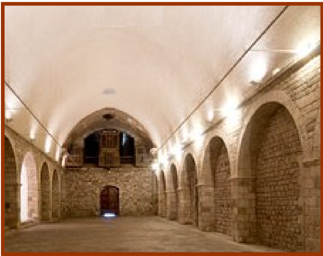
Estat actual de l'interior de la capella

La institució podia atendre i mantenir aquesta obra caritativa gràcies als béns cedits pel fundador, pels procuradors de l'antic hospital de la Seu i per la caritat dels barcelonins manifestada cada dia en forma de pa i, a l'hora de la mort, en deixes testamentàries. La catedral també hi contribuïa diàriament amb quatre pans petits, amb el dit àpat canonical, el dia de presa de possessió dels nous canonges i amb el llit dels clergues difunts de tota la diòcesi, tal com es venia fent en l'antic hospital de la Seu.