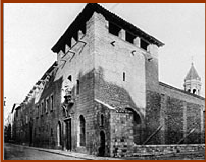
La capella de l'hospital de la Santa Creu es va construir l'any 1444, sobre l'estructura de l'hospital d'en Colom.

Amb l'administrador o hospitaler acostumava a