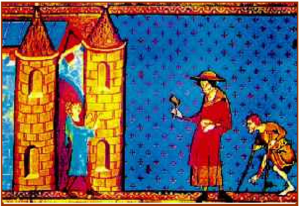
Arribada de dos leprosos a la porta d'un llatzeret, vers 1250 (Miroir historial. Bib. de l'Arsenal de Paris)

Quan els croats van retornar a les seves llars, després de lluitar a Terra Santa, molts d'ells estaven suposadament afectats per la lepra o per alguna malaltia que s'hi confonia, com la sífilis. Llavors, la valoració moral de la malaltia va canviar: va deixar de ser un càstig diví per esdevenir una malaltia quasi santa. Va sorgir una actitud solidària vers els leprosos i cada vegada foren menys freqüents els “ritus d'exclusió”. Després de Concili Laterà III, el 1179, la lepra ja no va ser motiu de separació obligada de la família.