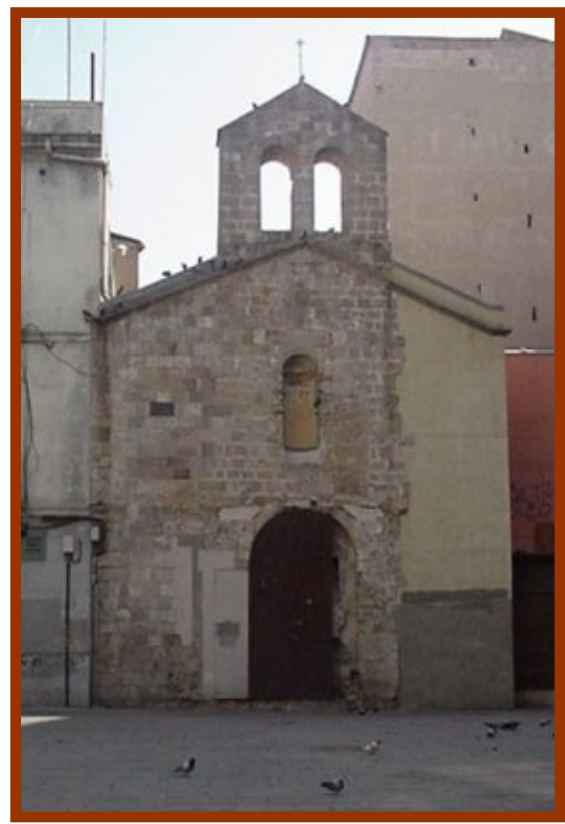
Hospital de leprosos de Sant Llàtzer de Barcelona segons el "Llibre de Taula" de 1674 de l'Hospital de la Santa Creu de Barcelona, i la seva capella tal con és en l'actualitat.

Alguns estudiosos dels antics hospitals de Barcelona afirmen que l'Hospital de Sant Llàtzer va ser fundat durant el segle IX, en temps del bisbe Guillem. Sembla que aquesta data, segons les fonts trobades, és mancada de tot fonament. Tot i no poder descartar la possibilitat de l'existència d'una