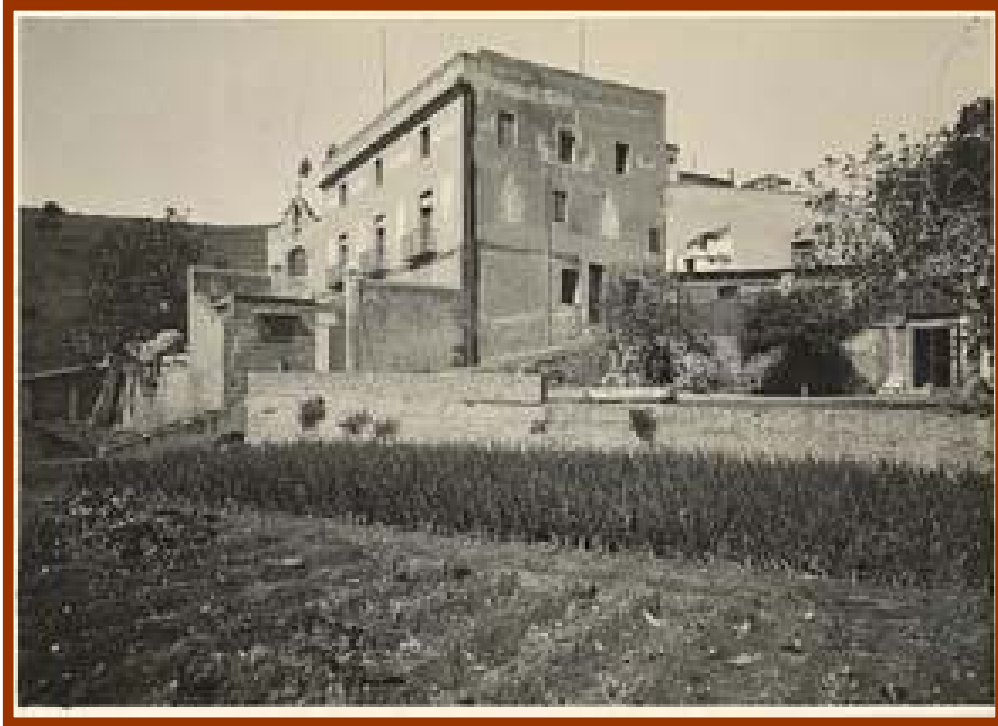
Can Masdéu a la vila d'Horta vers 1920

esdevingués propietat de la seva comunitat. Cap de les dues iniciatives no va reeixir i els malalts de lepra van romandre al mateix lloc fins que, l'any 1906, van passar a ocupar l'antiga masia Can Masdéu, als afores de la vila d'Horta.