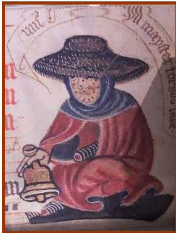
Leprós representat en un manuscrit del segle XIV

Els bisbes reunits al concili de Lió van alleugerir-ne la situació i els van autoritzar a sortir per captar a la vora dels camins, sempre que anessin tapats de cara, portessin guants i fessin sonar dos bastons o una campaneta, per tal de ser identificats. No podien tocar persones sanes ni menjar amb elles. Els era prohibit entrar als hostals i a les esglésies, encara que hi havia llocs on se'ls permetia oir missa a través d'unes finestretes situades al ras del carrer.