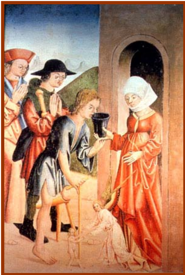
Una beguina assisteix a pobres i malats: miniatura d'un còdex del segle XV (Landesmuseum, Linz, Austria)

L'hospital, de fundació episcopal, va ser des del primer moment administrat pel bisbe i el capítol, que delegaven el seu govern en el rector i els administradors. El bisbe Ponç de Gualbes, per disposicions de 1307 i en especial en les Noves Ordinacions de 1326, va establir una reglamentació per la qual, en l'esdevenidor, s'havien de regir el rector, els administradors i els malalts. És a dir, va donar les directius pel govern de l'hospital.