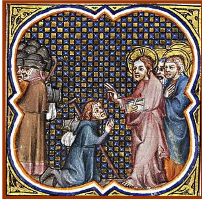
Jesús cura a un leprós Mt 8, 2-3

Els evangelis utilitzen la paraula rentar o purificar en lloc de curar. A Mt 8, 2-3 un leprós diu a Jesús: “ Senyor, si ho voleu, podeu purificar-me”. Ell li diu: “Ho vull, sigues purificat.” El va curar i el va restituir a la societat.