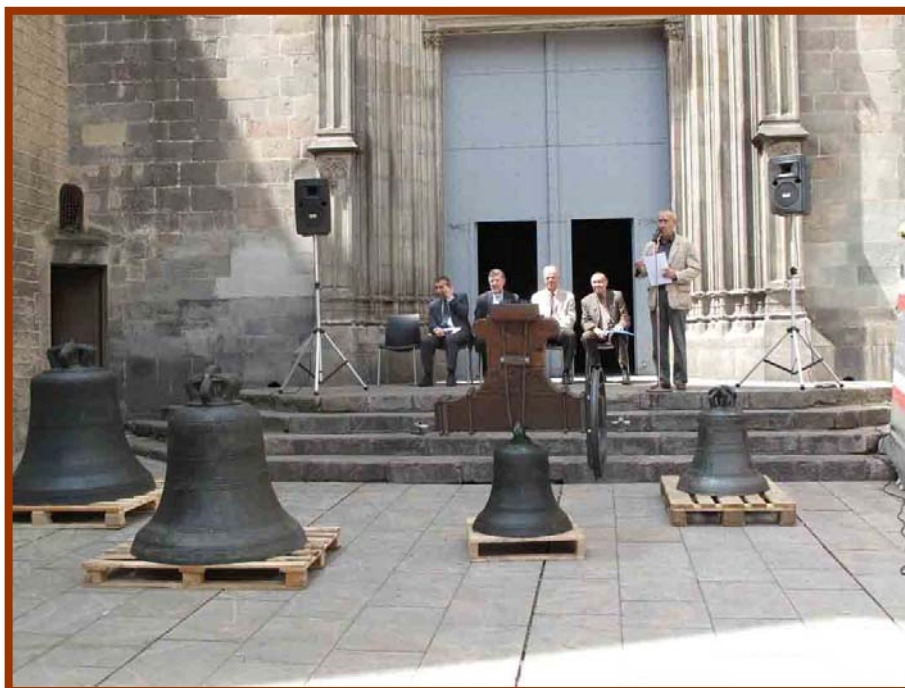
Arribada de les campanes, després de la seva restauració, a la plaça de Sant Just, el dia 11 de juny de 2013, on es celebrà un acte amb assistència de representants de la Parròquia, l'Arquebisbat i l'Ajuntament.

de l'aurora perquè els vilatans anessin a treballar a la sortida dels sol, i el de l'acabament de la jornada, que acostumava ser a l'hora de vespres. A més a més de les hores canòniques, hi havia diferents tocs que s'havien de fer durant la celebració de la missa. Les campanes també servien per congregar la comunitat per un esdeveniment o anunci important i per noticiar el naixement o la mort dels veïns. Un toc important era el "seny del lladre", que podríem dir que era un toc de seguretat, quan es tancaven les portes de les muralles i les persones d'ordre es recollien a les cases perquè en la foscor de la nit començava la jornada de lladres i valentons.