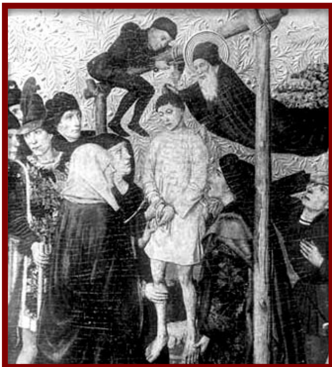
Sant Antoni lliura el cos d'un ajusticiat a unes beguines. ( Retaule de Jaume Huguet, segle XV, procedent de l'església de Sant Antoni de Barcelona).

canvi d'un pagament de 25 lliures barceloneses cada any.