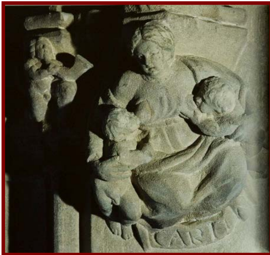
Mènscula del pati gòtic del Palau de la Generalitat que representa una dida alletant dos infants. (Marc Safont, c.1425)

L'infanticidi, l'abandonament i la venda de criatures, al marge de conjuntures polítiques, culturals o econòmiques, va ser una xacra social permanent al llarg de la història. A tot Europa, els nostres avantpassats d'època antiga i medieval van passar una fam tan terrible que de vegades van arribar a practicar l'infanticidi i un canibalisme de supervivència.