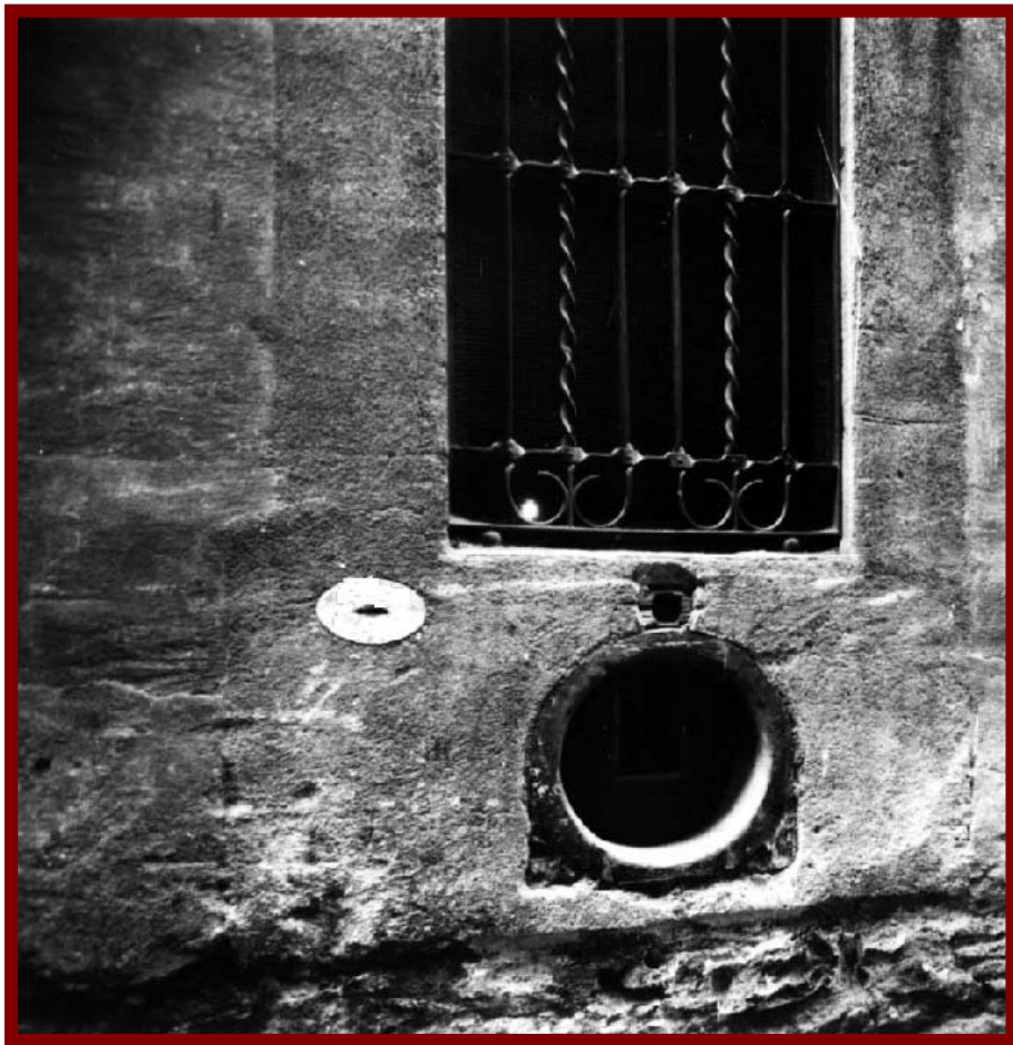
Torn de recollida d'infants abandonats de l'antiga Casa de Misericòrdia al carrer de les Ramelleres de Barcelona, abans de la seva restauració.

L'aportació més gran de l'Església per suavitzar aquella traumàtica situació va arribar de la mà del pare del monacat d'occident sant Benet de Núrsia (segle VI), que per mitjà de l'oblació, va aconseguir que els infants fossin entregats als monestirs per ser consagrats a Déu i per ser-hi educats.